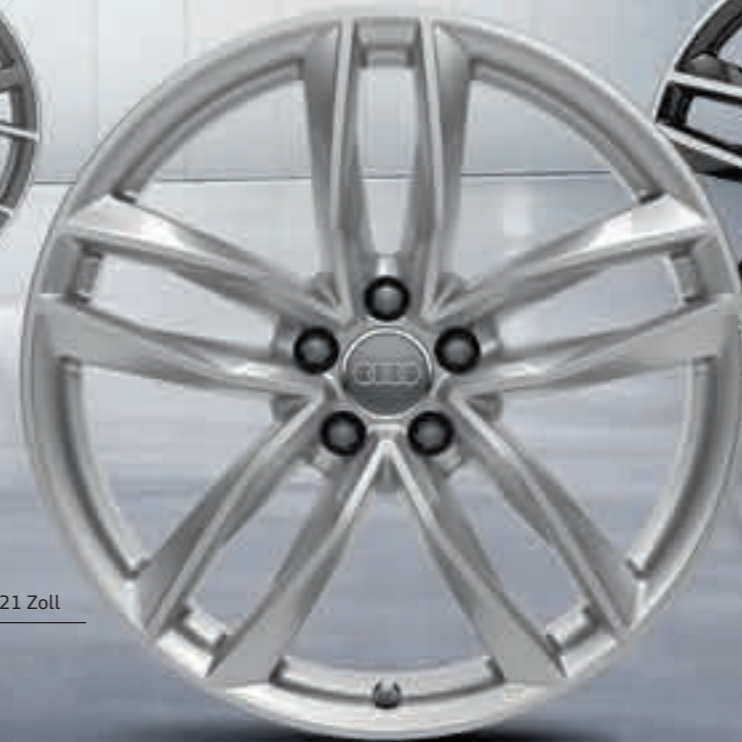
03 // 21 Zoll