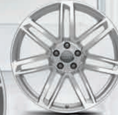
06 // 20 Zoll