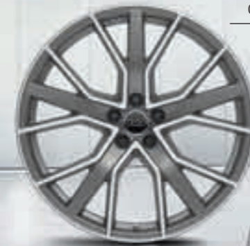
02 // 21 Zoll