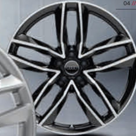
04 // 21 Zoll