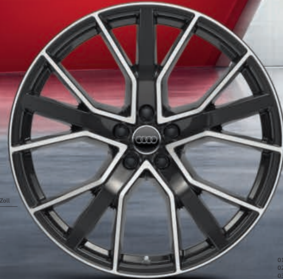
01 // 21 Zoll