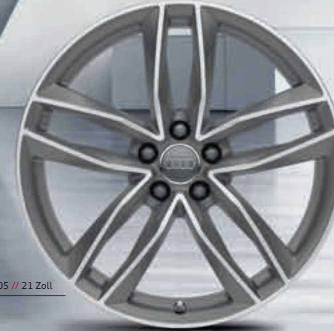
05 // 21 Zoll